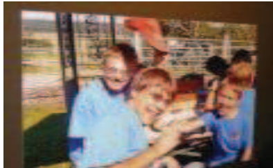
Für dieses Foto vergab die Jury den ersten Preis der Vereinsausstellung zum Thema »Behinderung hat viele Facetten«. Titel: »Drei lachende Kinder im blauen T-Shirt«.